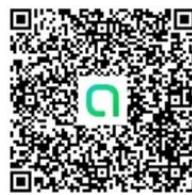
花蓮縣雙語共備-藝術領域