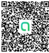
花蓮縣雙語共備-健體領域