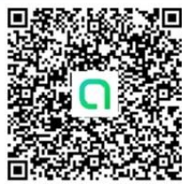
花蓮縣雙語共備-科技領域